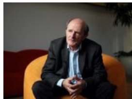
Jean-Louis Etienne, Explorateur Et Médecin, Grand Témoin Du Safe Water Summit

« Tout le monde veut de l'eau... cette ressource il va falloir la partager »